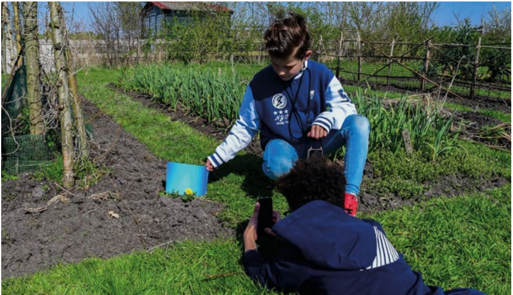
Op woensdag 2 april was er onder deskundige leiding van fotografe Ilona Hartensveld in de Tussentuin in Kortenhoef een workshop voor kinderen ‘Natuurfotografie met je mobiel’. Deze workshop was georganiseerd door Duurzaamheidscentrum Wijdemeren in samenwerking met De Samentuin en Ilona Hertensveld Fotografie