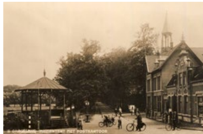
Foto: De Smidsbrug in vroegere tijden

De tentoonstelling laat de ontwikkelingen zien met betrekking tot de lintbebouwing van het Noorder- en Zuidereinde in oude foto's en de situatie anno 2025. Ook zijn er attributen te zien die te maken hebben met de geschiedenis van 's-Graveland zoals de wasserijen en middenstand. De ongeveer 4 kilometer lange lintbebouwing is op zich niet uniek maar 's-Graveland zelf wel dat al eeuwen als een zeer herkenbare rechthoek op elke kaart van het Gooi meteen terug te vinden is. Het dorp is sinds 1986 een Rijks beschermd