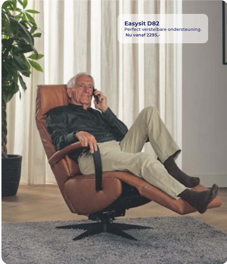
Easysit D82 Perfect verstelbare ondersteuning. Nu vanaf 2295,-