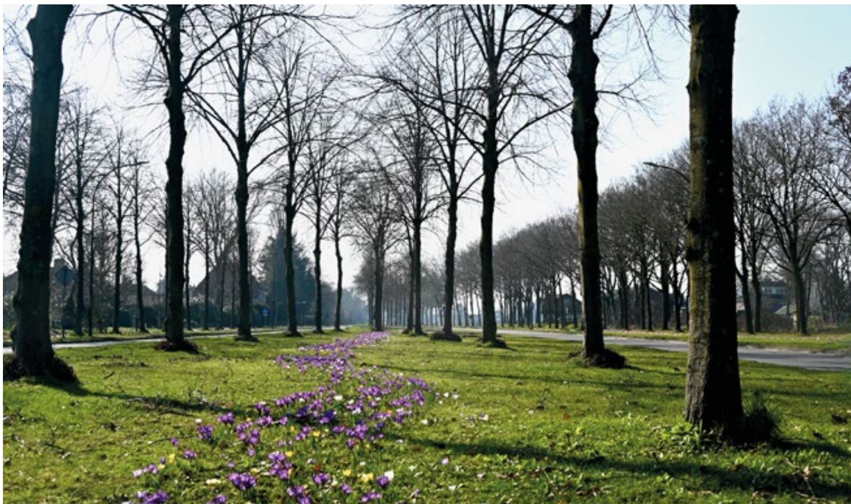
Spring is in the air ofwel de lente komt eraan!