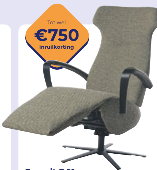
Easysit D01 Prachtig design en gebruiksgemak. Nu vanaf 2395,- (incl. inruilkorting)