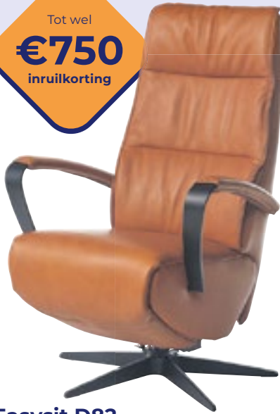
Easysit D82 Perfect verstelbare ondersteuning. Nu vanaf 2295,- (incl. inruilkorting)