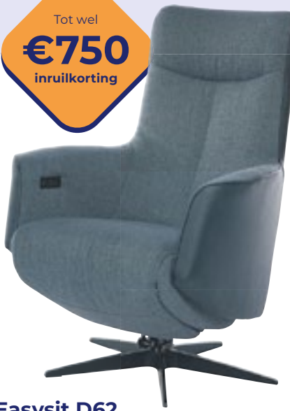
Easysit D62 Stijlvol design met topcomfort. Nu vanaf 2295,- (incl. inruilkorting)