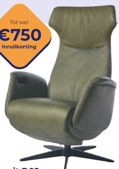
Easysit D02 Comfort, stijl in in één fauteuil. Nu vanaf 2395,- (incl. inruilkorting)

Alle stoelen zijn leverbaar met elektrisch verstelbare rug en voetensteun. In verschillende maten, kleuren, bekleding en opties.