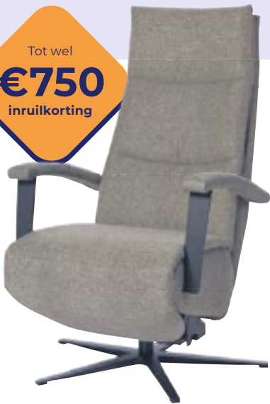
Easysit F30 Comfort dat zich aan jou aanpast. Nu vanaf 1895,- (incl. inruilkorting)