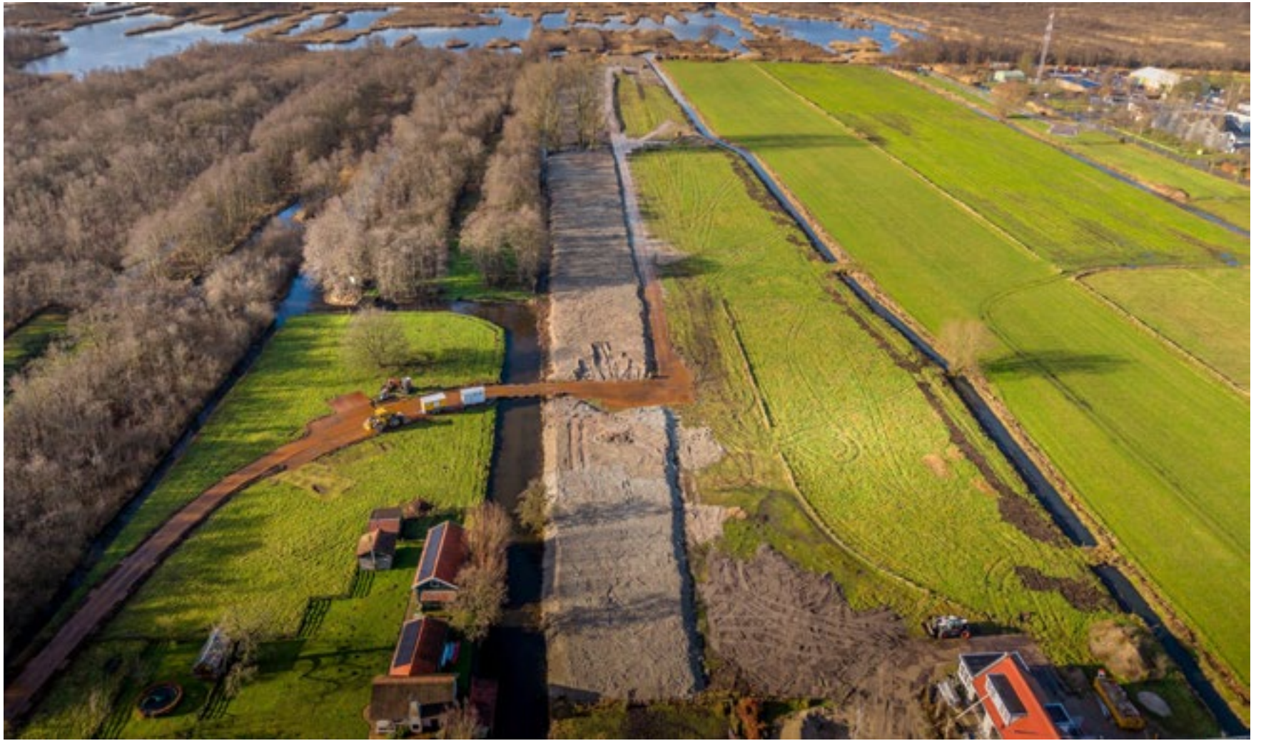
Aan de Kortenhoefsedijk wordt de stortplaats Boom met tonnen zand opgehoogd.