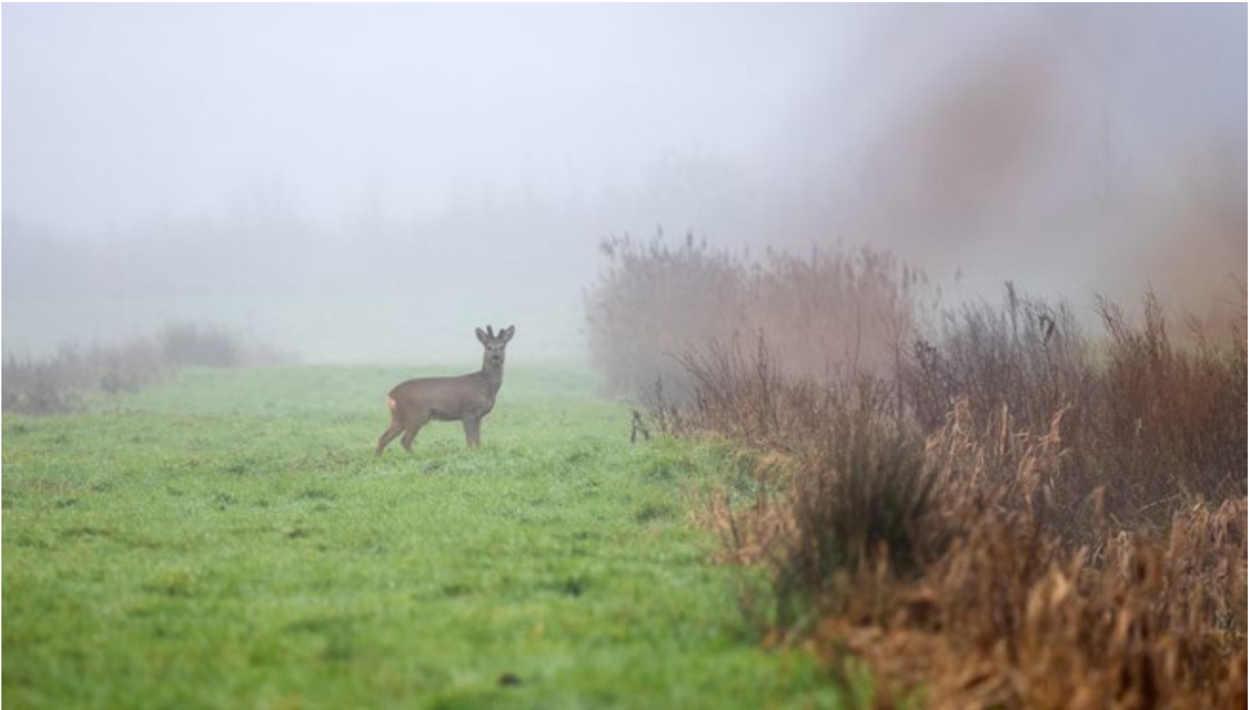
Tijdens grijze dagen even naar buiten. Dan kom je dit lichtpuntje tegen in de Horstermeerpolder!