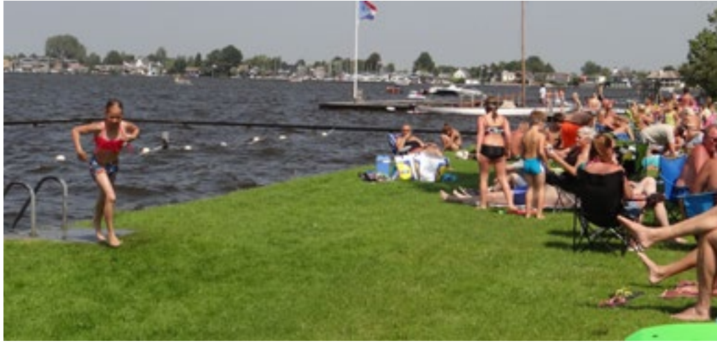
niet het naaktstrand