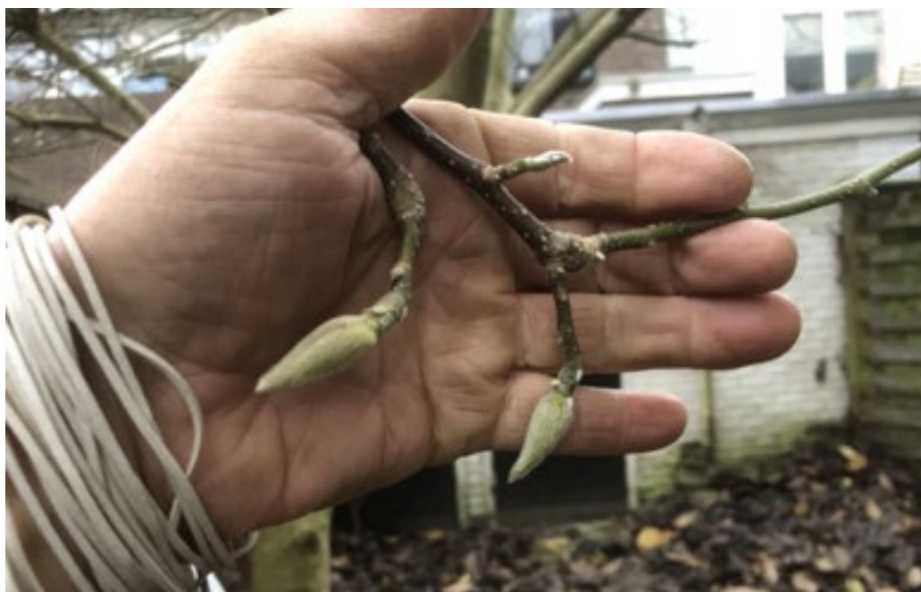
Foto: De knoppen voor het nieuwe seizoen staan alweer klaar

de kweker.... Maar.... We laten onze mooie tuin nog even genieten van zijn welverdiende rust.....sssssst!!!