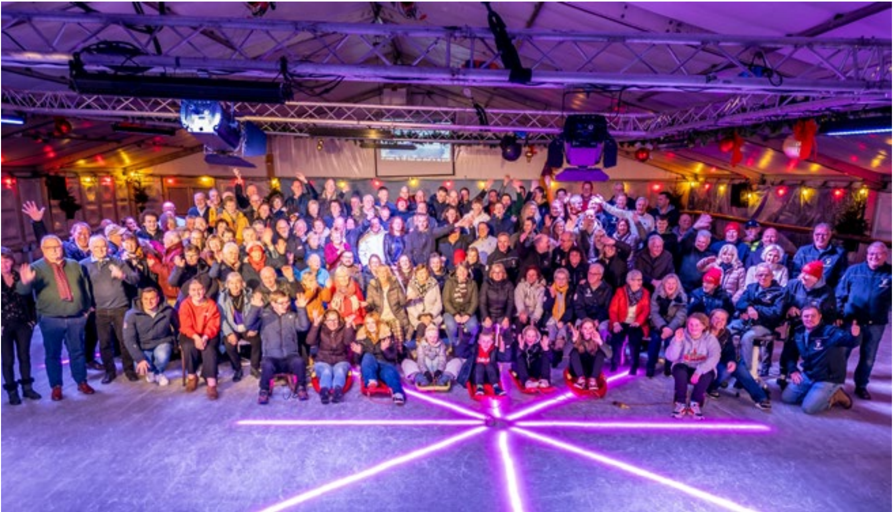
Alle vrijwilligers op het ijs bij het Smeltfeest, het traditionele slot van Nederhorst on Ice