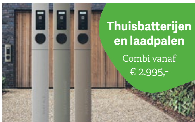
FOTO VAN DE WEEK