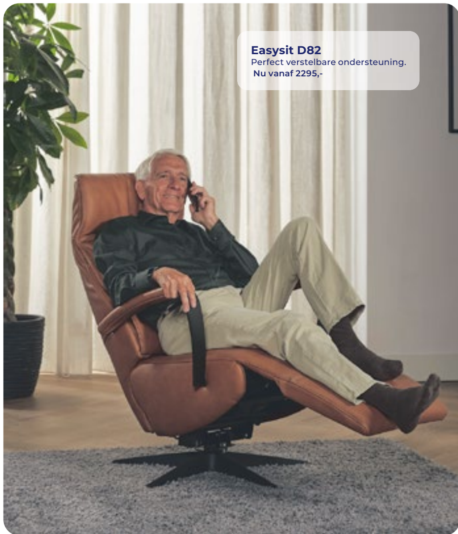
Easysit D82 Perfect verstelbare ondersteuning. Nu vanaf 2295,-