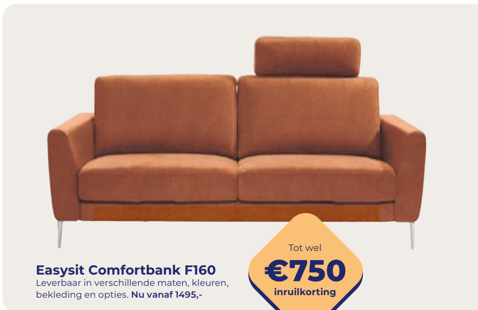
Easysit Comfortbank F160 Leverbaar in verschillende maten, kleuren, bekleding en opties. Nu vanaf 1495,-