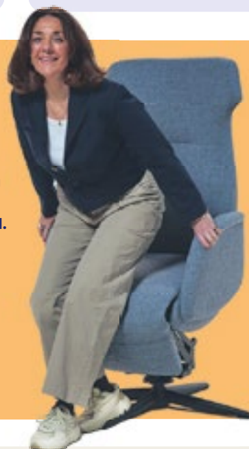
Easysit D02 Comfort, stijl in in één fauteuil. Nu vanaf 2395,-